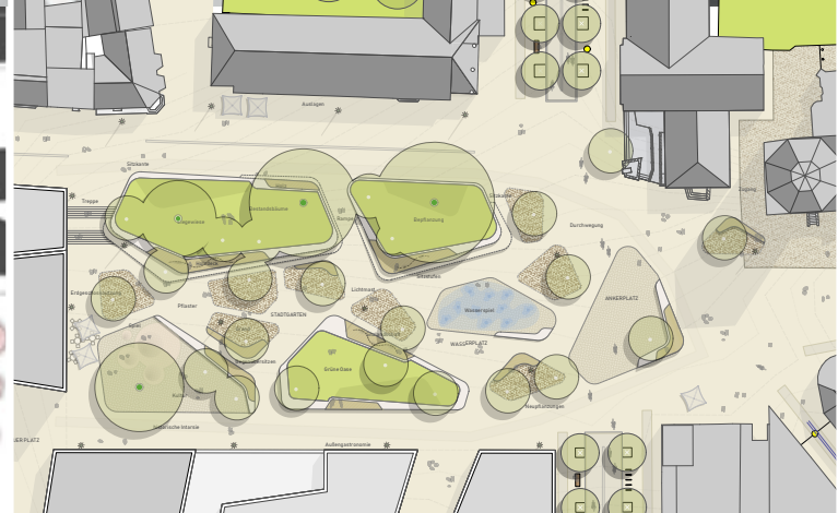
oben: Visualisierung Rahmenplan, unten links: Rahmenplan